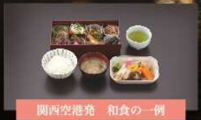
関西空港発 和食の一例