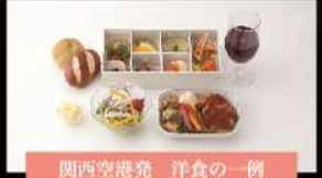
関西空港発 洋食の一例